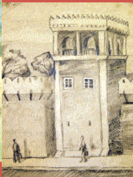
Ансамбль Донского монастыря. Илья Романов, 13 лет, пр. кар.