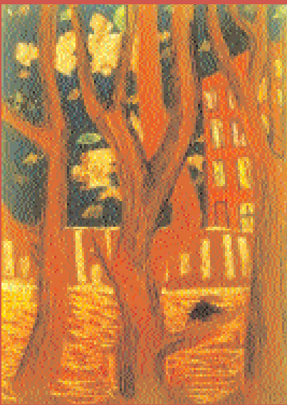
Наш район вечером. Леонид Жустарев, 12 лет, пастель