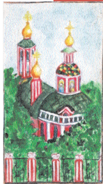
Храм Ивана-воина. Илюшина Анастасия. Доска, акварель

Помимо удачных пленэрных зарисовок (практически самостоятельных работ), композиций, выполненных в традиционных техниках живописи и графики, городские мотивы нашли свое решение в декоративном варианте — роспись досок (Храм Ивана Воина. Анастасия Илюшина, 12 лет), пластиковых тарелок (композиции в круге по мотивам архитектуры Донского монастыря), объемные макеты из бумаги, пластилина, клея (Кусково — отдельные здания), рельефы на картоне, выполненные в пластилине (музеи Москвы), коллажи (улицы Москвы).