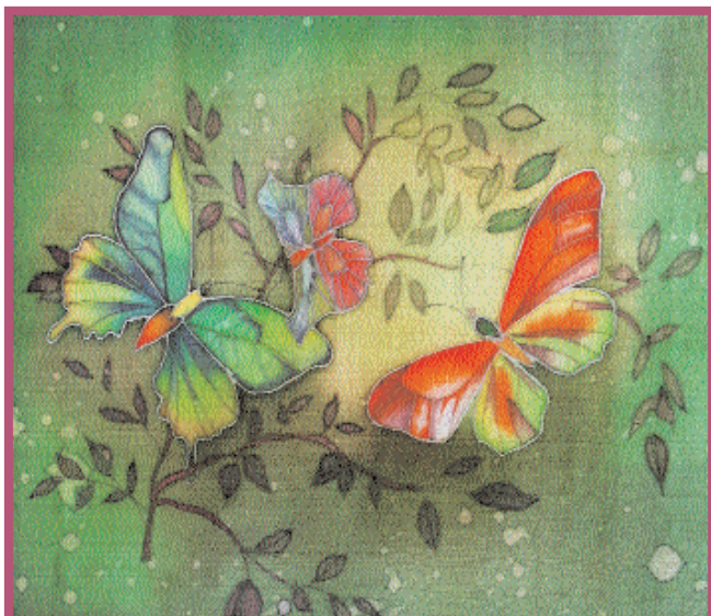
Бабочки. Ирина Кирьянова. 14 лет. ГОУ ЦО № 109

Способность создания выразительных цветочных образов.