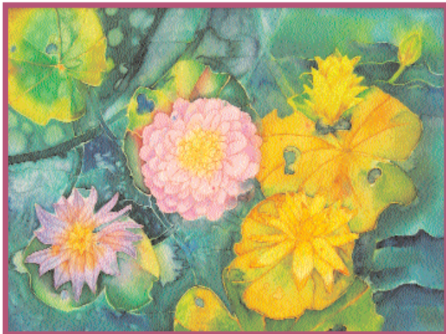
Нимфеи. Софья Датская. 10 лет. ГОУ ЦО № 1477