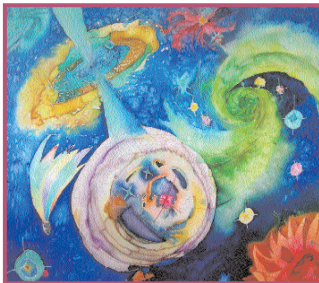
Космос. Софья Датская. 10 лет. ГОУ ЦО № 1477