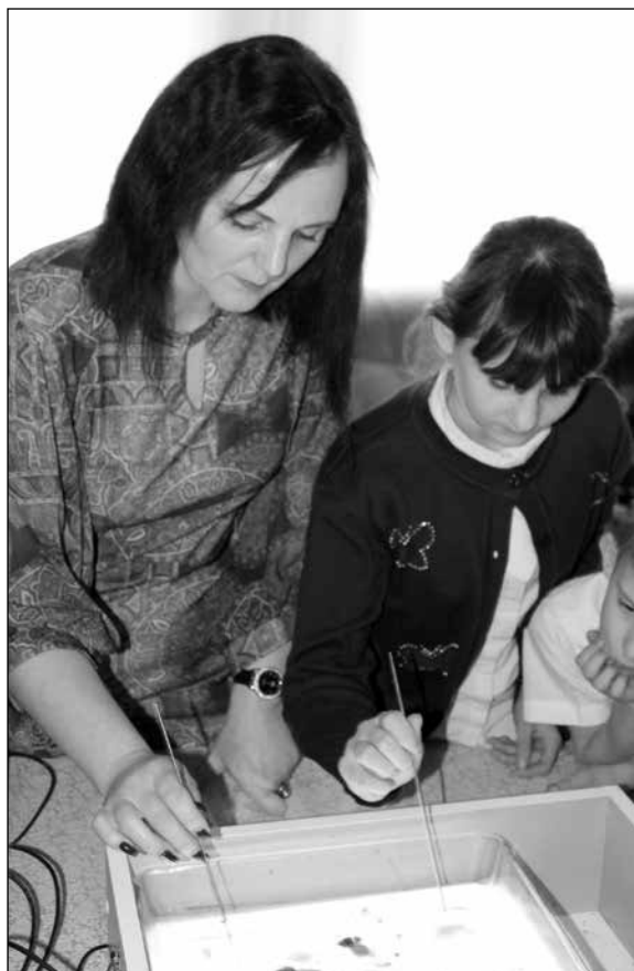
Работа в технике Эбру

А иногда ребёнку просто необходима зона уединения — место, где можно отдохнуть от шума, побыть наедине со своими мыслями, где можно побеседо-