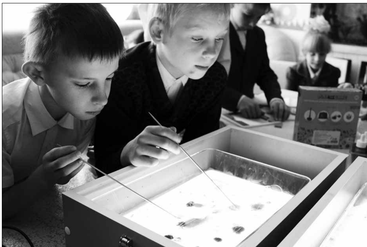
Работа в технике Эбру

Эбру — это рисование жидкостями. Нанесение одной жидкости на поверхность другой создаёт невероятный