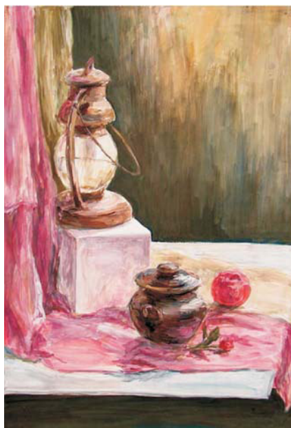
Работа Натальи Литовской