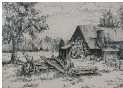
Работы Марии Маняк