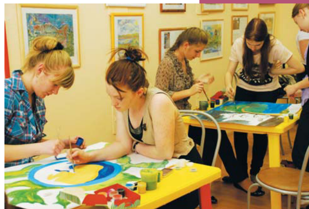
Коллективное выполнение работ в старших классах