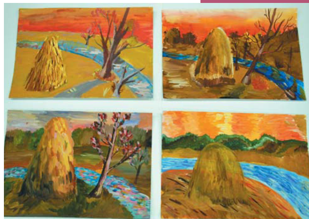
Работы, выполненные учениками 5-го класса на мастер-классе «Закат солнца»

озерье», но и на образовательных выставках, на ВВЦ, в Центральном выставочном зале Манеж), в Париже, в штаб-квартире ЮНЕСКО, и детском парке «Жарден д'Акклиматасьон», в центрах образования № 1048, 1443, 1927, 2036, в средних общеобразовательных школах № 449 и 1714 г. Москвы, в детских садах № 2343 и 2350, в детской библиотеке № 33 ЦБС № 3, № 97, библиотеке № 101, в музее «Чебурашки» ВАО г. Москвы, во Дворце творчества детей и молодежи «Восточный», VI фестивале «Экология. Творчество. Дети», на V слете детских общественных объединений ВАО г. Москвы, на презентациях персональных художественных выставок педагога и методических выставок «Учитель и ученик». Иногда по просьбе родителей и бабушек проводятся мастер-классы и для взрослых.