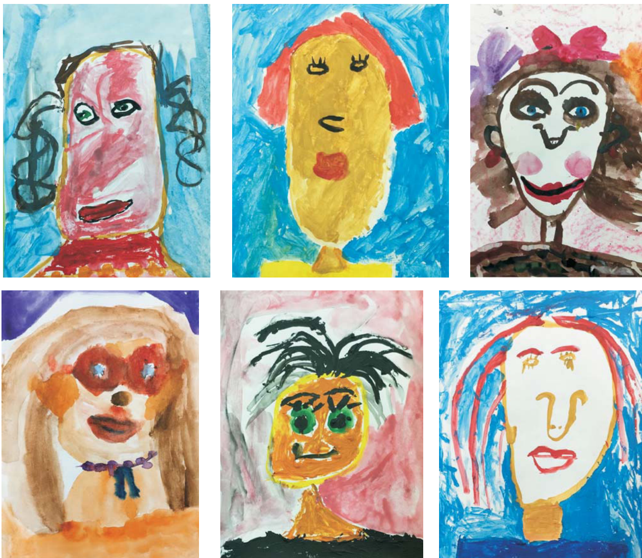
Рис. 2. Автопортрет

Не менее часто, чем портреты других людей, дети рисуют автопортреты. Задание нарисовать