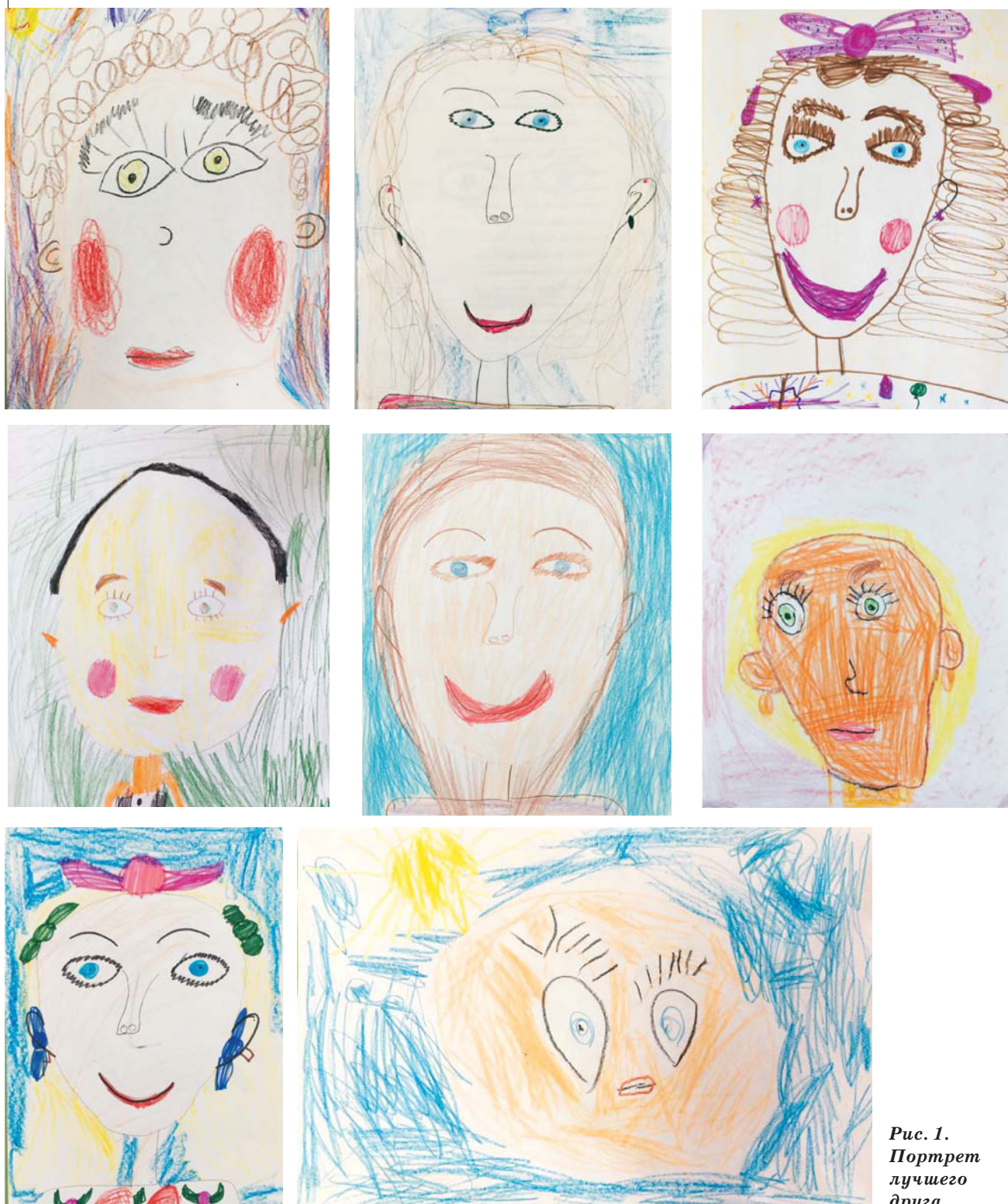
Рис. 1. Портрет лучшего друга

письма. Давайте отметим, какие идеи желательно в этом случае зафиксировать: