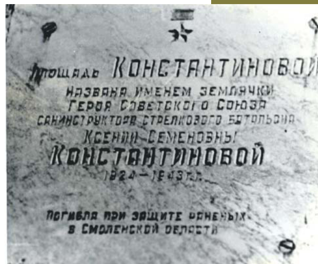
Мемориальная доска, установленная в Липецке

Председатель Президиума Верховного Совета СССР