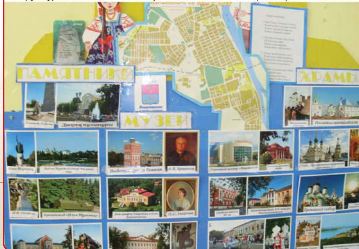
Структура бесед с детьми старшего дошкольного возраста (беседы)