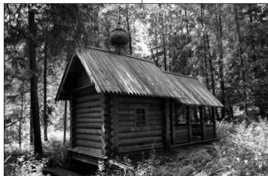
Старообрядческий родник у дер. Бледны Городецкого района, обустроенный Братством Александра Невского

В национальном культурном наследии родники занимают особое место, являясь одновременно культурными, природными, а иногда и историческими объектами.