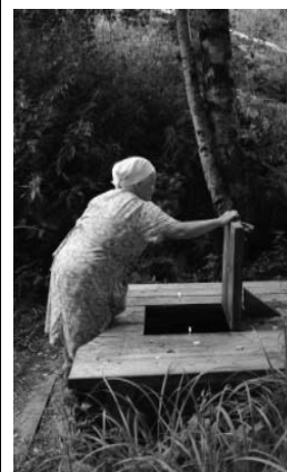
Почитаемый источник у дер. Смиркино, Городецкого района