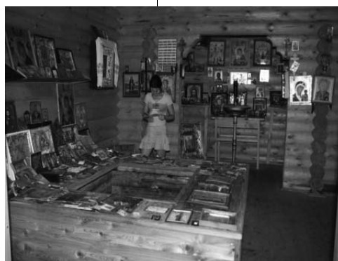
Внутреннее убранство часовни на Николином ключе, близ Городца