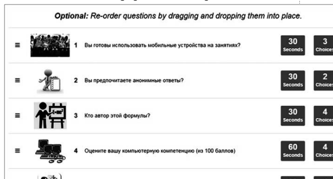
Рис. 3. Вид созданного опроса в архиве сервиса