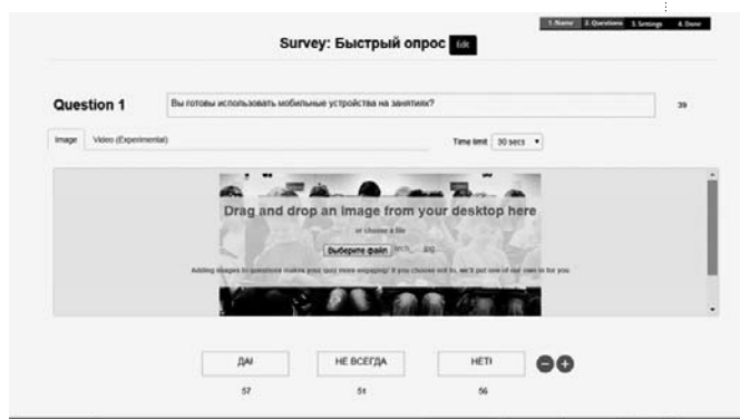
Рис. 2. Поле оформления вопроса