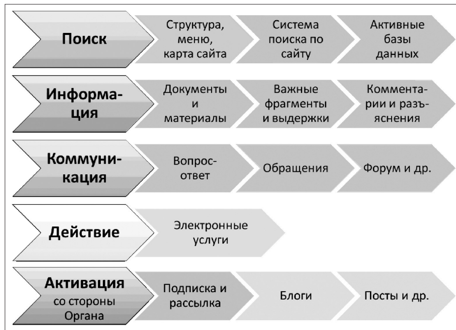
Рис. 3. Структура пользовательского запроса

Интервьюирование представителей родительской общественности и анализ статистики посещения пользователями отдельных страниц официальных сайтов органов управления образованием различного уровня позволили построить схему пользовательского запроса к этим сайтам (рис. 3).