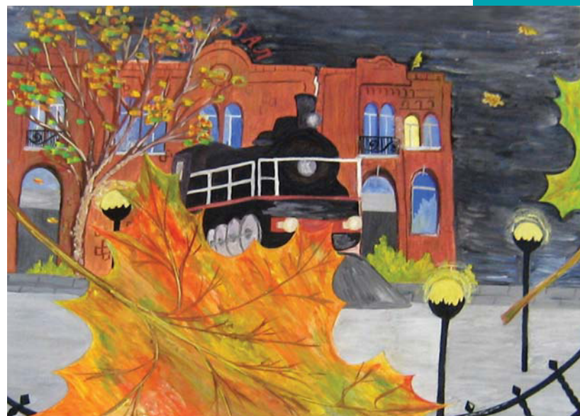
Лобжанидзе Ксения, 13 лет. Городской вальс (гуашь)