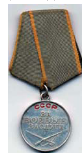
Медаль «За боевые заслуги»