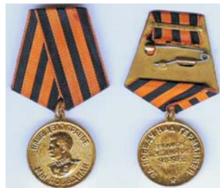
Медаль «За победу над Германией в Великой Отечественной войне 1941–1945»