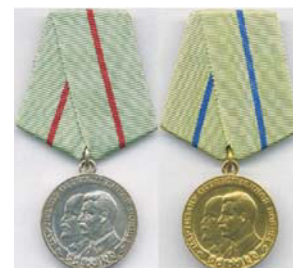
Медаль «Партизану Отечественной войны»

Для него война закончилась в Белоруссии в 1944 году. Там он был направлен на восстановление разрушенного хозяйства как специалист агроном в г. Пинск.