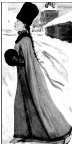
А. Рябушкин «Московская девушка XVII века»

Линия выражает условный контур предмета, его очертания. Используя простейшие графические средства, можно добиться выразительности образа. Изящный изгиб тела, наклон головы, движение рук передают эмоциональное или динамическое состояние человека.