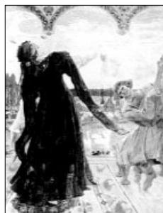
В. Васнецов «Царевна Лягушка»

Изобразите женский образ, используя очертания линий как выразительное средство (изгиб тела, поворот головы, движение рук). С их помощью вы придадите образу спокойный, нежный, хрупкий, таинственный или весёлый, озорной облик. Вслушайтесь в музыку, она вам поможет раскрыть особенности характера героини вашего рисунка