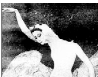
Ф. Решетников «Майя Плисецкая в балете «Лебединое озеро»

Идёт плавно, спокойно, легко, величественно, гордо, красиво