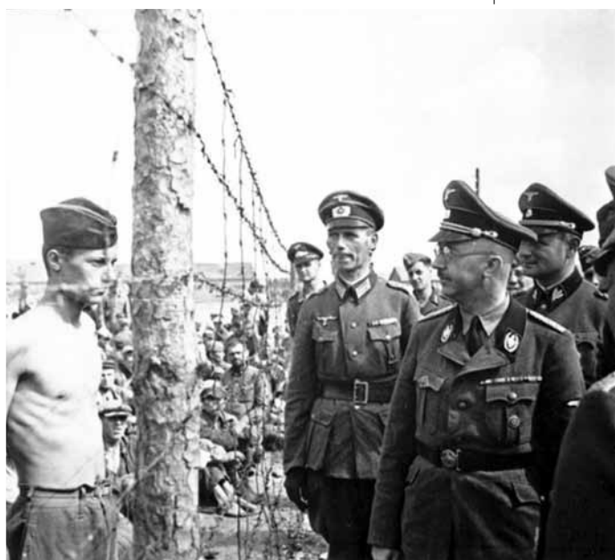
Г. Гиммлер осматривает лагерь военнопленных в Минске. 1941 г.

арестов и расстрелов среди мирного населения Минска [4, с. 81]. Документы вермахта являются свидетельствами бесчеловечной оккупационной политики захватчиков. Так, например, в оперативной сводке № 36 полиции безопасности от 28 июля 1941 г. сообщалось: «В Минске ежедневно ликвидируется 200 человек. Речь идет о большевистских активистах, агентах, уголовных элементах и т.д., которые были выявлены в лагерях для гражданских лиц». В оперативной сводке № 73 от 28 августа 1941 г. говорилось: «В Минске при прочесывании лагеря пленных для гражданских лиц было расстреляно 615 человек» [1, с. 33]. «Новый порядок» в захваченном фашистами Минске стал настоящим адом для еврейского населения города. Через Минское гетто, одно «из самых