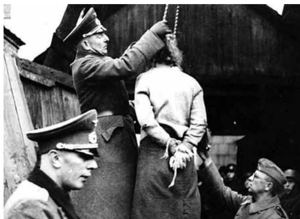
Казнь Марии Брускиной

26 октября 1941 года в оккупированном Минске фашисты устроили первую публичную казнь. Среди двенадцати человек, над которыми была совершена расправа, была эта юная девушка. В честь казненных Машиных соратников, Кирилла Труса и Ольги Щербацевич, в Минске названы улицы. Но история распорядилась так, что на протяжении нескольких послевоенных десятилетий имя юной героини оставалось неизвестным. Только в 2008 году на месте казни минских патриотов, на мемориальной доске, появилась надпись: М.Б. Брускина. Однако до сих пор эта бесстрашная девушка, мужественно выдержавшая пытки и издевательства гитлеровцев, с достоинством принявшая смерть, не награждена посмертно правительственной