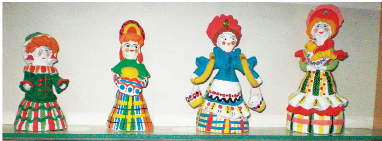
Работы воспитанников кружка «Юный художник»