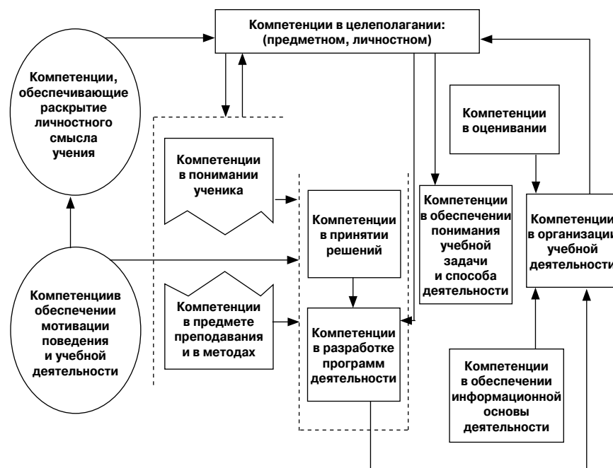
Рис. 1. Модель профессионального стандарта с позиций деятельности

осуществление учебной (воспитательной) деятельности.