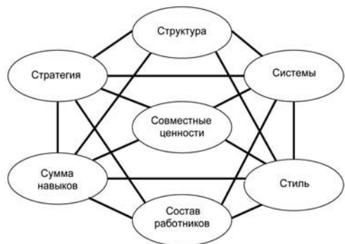
Рис. 2. Схема 7-С компании «Маккинси»

управления, системы и процедуры, совокупность приобретённых навыков и умений, совместно признаваемые ценности (т.е. культуру). Схема, которую наши коллеги окрестили «счастливым атомом», была повсеместно воспринята как, по-видимому, удачный способ мышления о проблемах организации: