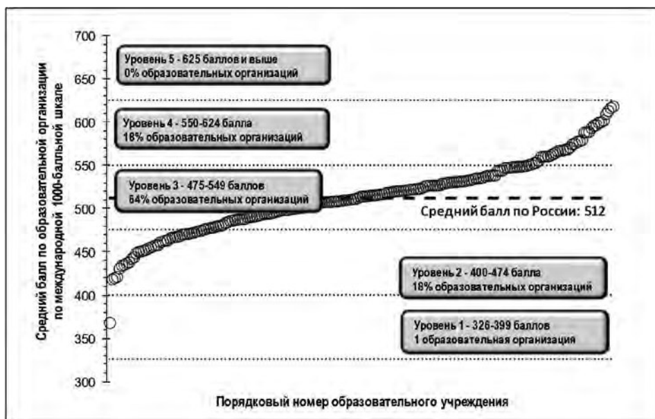
Рис. 3. Распределение образовательных организаций по средним баллам их учащихся

ностно значимых финансовых вопросов (тем). В их числе повседневные покупки товаров, платежи, расходы, соотношение цены и качества, банковские карты, чеки, банковские счета, валюты. Задания из этой области включали следующие требования: