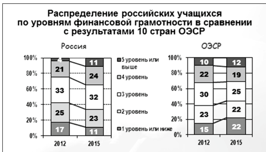
Рис. 2. Распределение российских учащихся по уровням финансовой грамотности (в сравнении с результатами стран ОЭСР)

нем 3-м уровне. По странам ОЭСР этого сказать нельзя из-за выросшего до 22% числа учащихся, оказавшихся ниже порогового уровня.