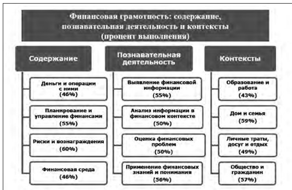
Рис. 4. Структура международного теста по финансовой грамотности

запланированную покупку); оценить влияние различных факторов на расходы; умение оценить преимущества и недостатки формирования человеческого капитала посредством инвестиций в различные виды образования и профессиональной подготовки.