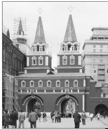
Восстановленные Воскресенские триумфальные ворота. 1997 г.

Не будем забывать о том хорошем, что было в девяностые годы, когда сбывались наши мечты о восстановлении утраченных в XX веке храмов, памятников, утраченной исторической памяти. В эти годы к нам вернулись мыслители, без которых нельзя представить себе современной российской культуры и школы: И.А. Ильин, В.В. Розанов, Н.А. Бердяев, вернулись «репрессированные» произведения Н.В. Гоголя, Б.Л. Пастернака, многих других русских писателей и учёных. В 90-е годы наша наука прирастала возвращёнными именами — и мы получили невиданное богатство, которое в той или иной, редуцированной или дополненной форме навечно останется нашим всенародным достоянием. 90-е годы были не только временем утрат, но и временем обретений — пусть и не осмысленных нами. Авторы этих строк много лет мечтали о том времени, когда к Историческому музею на Красную площадь Москвы вернутся Воскресенские ворота с Иверской часовней. Святое место, символ матушки-Москвы. Не забыть тех чувств, которые мы испытывали, разглядывая старинные открытки с двумя неравными башенками,