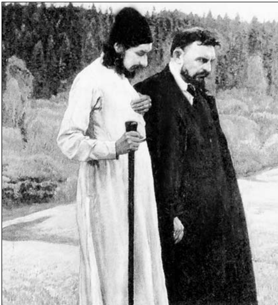
«Философы». Худ. М. Нестеров, 1917 г.