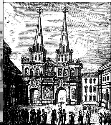
Вид Воскресенских триумфальных ворот. Гравюра XVIII в.