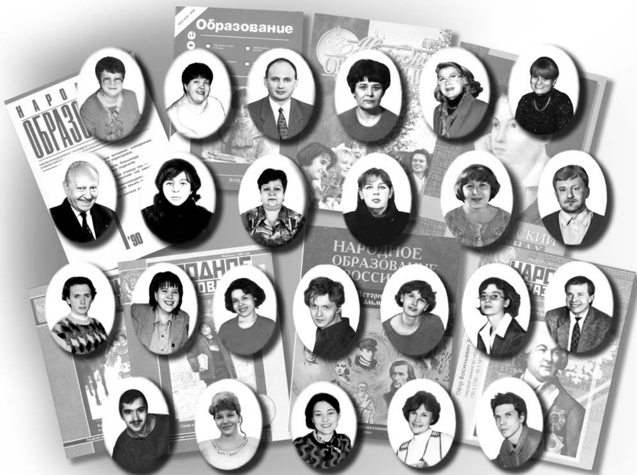
Коллектив редакции «Народное образование», 2003 год

С 1940 годов журнал «Народное образование» не раз писал о суворовских училищах. То были статьи о выпускниках-суворовцах, о педагогах и администраторах, работавших с юными суворовцами. Новым и заметным явлением нашей школьной жизни стали в последнее десятилетие кадетские корпуса. Говорят, «новое — это хорошо забытое старое». В данном контексте — истинно так. Со времён императрицы Анны Иоанновны кадетские корпуса были одной из цветущих ветвей российского просвещения. В кадетских корпусах служили выдающиеся учёные России: историки, филологи, военные. А выпускники корпусов составили основу офицерского корпуса Российской армии, ярко проявили себя и в других областях. Сумароков, Кутузов, Нахимов... Список великих кадет можно продолжать бесконечно — и он свидетельствует о том, что корпуса были замечательным явлением в истории отечественной педагогики. И «Народное образование» заинтересовалось кадетской темой. В 1996 году была опубликована статья Ю. Макаренко «Здравствуйте, кадеты!» (№ 2), приветствовавшая возрождение славных традиций в современной России. Кадетские корпуса становятся всё более примечательным явлением культурной жизни разных регионов России. Вокруг них создаётся творческая, трудовая атмосфера. В 1997 году в «Народном образовании» появилась статья Ю. Филеева «Донские кадеты»: верны заветам старины» (№ 2) — публикация-репортаж из Ростовской области. Но нужно было обобщить