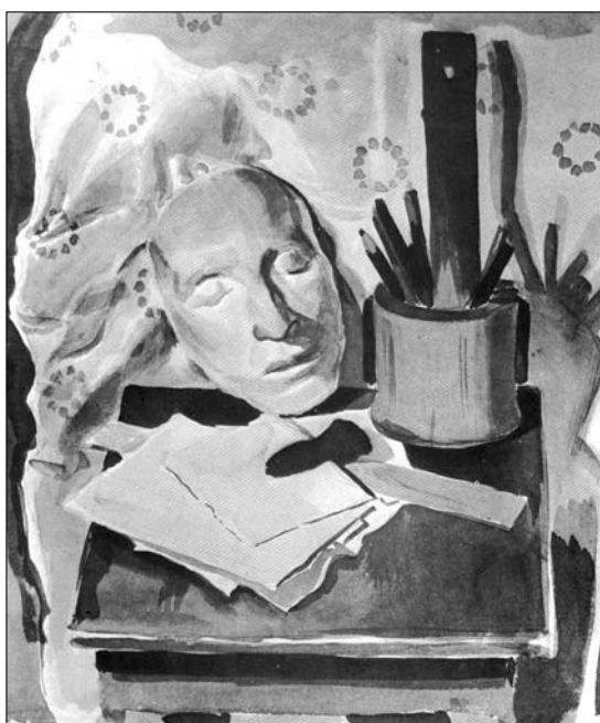
«Натюрморт с маской Пушкина» Худ. В. Фаворский. 1938 г.