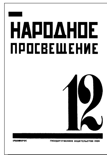
Облик журнала, разработанный А.С. Родченко. 1928 г.

Регулярно продолжает выступать в журнале и его главный редактор М.С. Эпштейн — человек из команды Луначарского. В том же номере «Народного просвещения» помещена его статья «Школы коммунистической молодёжи — в авангард