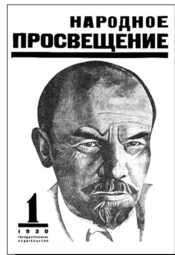
Облик журнала в 20–30-е гг. непрерывно менялся. «Народное просвещение» в 1930 году