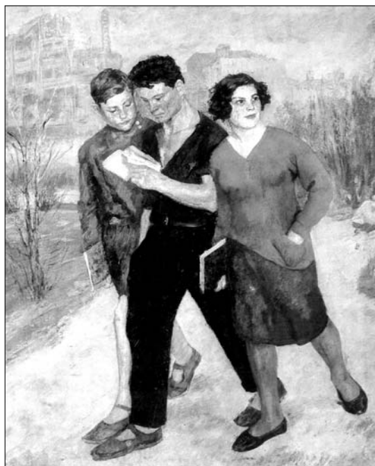
«Рабфак идёт». Худ. Б. Иогансон