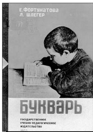
Букварь. Учпедгиз. 1933 г.