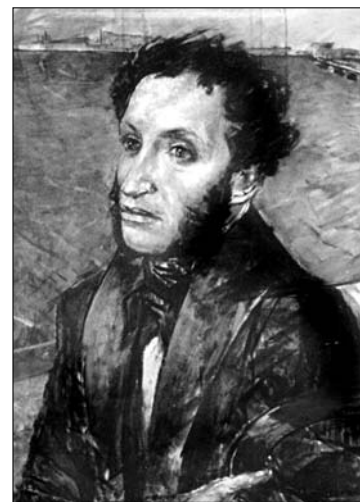
«Пушкин в Петербурге» Худ. К. Петров-Водкин. 1938 г.

Главным, не померкшим в десятилетиях, достижением наркома А.С. Бубнова была его работа по внедрению всеобщего среднего образования, всеобщей семилетки. В проведении подобной — амбициозной и сложной — программы была необходима железная рука непреклонного исполнителя воли высшего руководства. Ведь Сталин провозгласил, а Лебедев-Кумач воплотил в словах песни идею, что «за год» нужно сделать «дела столетий». А.С. Бубнов был настоящим энтузиастом культурной революции. Курс на «всеобщее среднее образование» был заявлен ещё при Луначарском. Анатолия Васильевича уже в конце 20-х годов начали критиковать за нерешительность в проведении этой программы. По мнению ряда современных исследователей, в неторопливости Луначарского был свой резон: наш первый нарком, неплохо знавший историю Французской революции с её календарями и мистериями, выжидал, пока