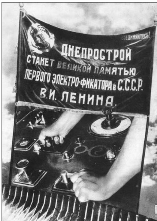
Фотомонтаж для специального выпуска журнала «СССР на стройке», посвящённого строительству Днепрогэс. Худ. Эль Лисицкий. 1932 г.