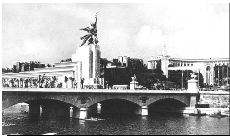
Открытка с Всемирной выставки в Париже в 1937 году. Павильон СССР