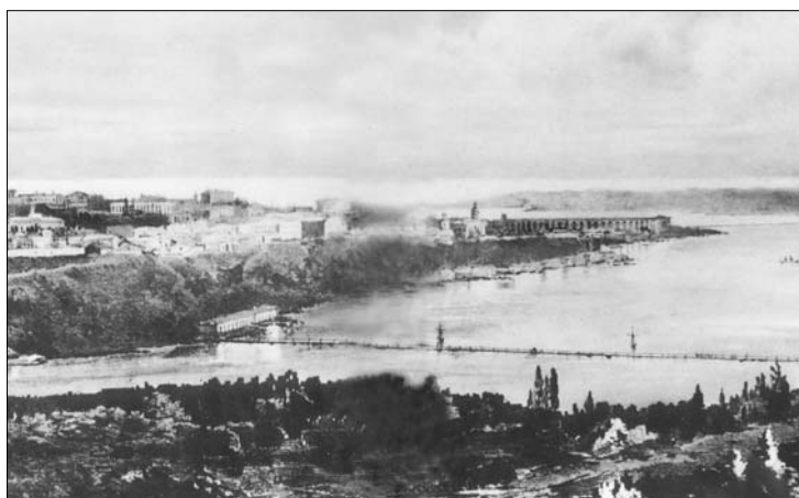
Вид города Севастополя. 1850 годы