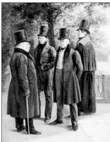
Пушкин, Крылов, Жуковский и Гнедич в Летнем саду. Худ. Г.Г. Чернецов 1832 г.

Надо заметить, что среди участников руганной арзамасцами «Беседы любителей русского слова» были такие писатели, как Г.Р. Державин, И.А. Крылов, молодые А.С. Грибоедов, П.А. Катенин, С.И. Бобров. Вызывают уважение и филологические изыскания А.С. Шишкова, который в 1812-м году превратился в идеолога Победы. Последовательный, искренний, неконъюнктурный патриот... Не зря даже литературный недруг — Пушкин — нашёл для него такие слова: «Сей старец дорог нам он блещет среди народа священной памятью двенадцатого года».