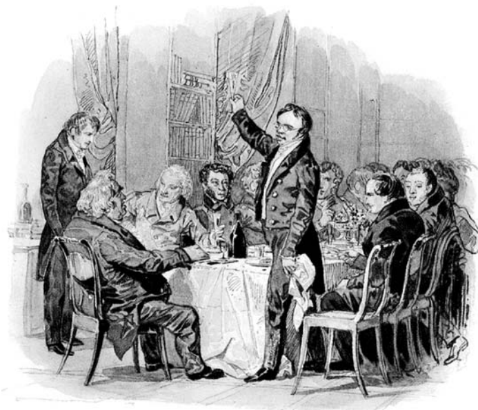
Заседание литературного общества

— Гуси, гуси! Кто вас не любит? Да долго ли вам беситься? Царство литературы почти в ваших руках — когда перестанете вы топить в моих чистых стряхах карликов Беседы и Академии? Давно уже не стало их бумажных тронов, — перестаньте с ними возиться! Какой чёрт вас с ними связал? Похвально было сказать свету, что они глупцы, похвально было согнать с Парнаса нестерпимую толпу лжегениев; но они давно уже рассеялись под вашими ударами. Чего же вам более? Но должны ли вы довольствоваться сими жалкими трофеями? От вас я ожидаю более; я ожидаю возобновления отечественной литературы, я ожидаю торжества разума и вкуса. Спасайте их, как некогда ваши предки спасали Капитолий: ныне не один Бренн им угрожает; полчища уродливых Бреннов с гасильниками в руках стремятся погасить ту бедную искру человечества и рассудка, которую я поручил в ваше попечение. Пора испугать их светом разума, разогнать их скопища объявлением войны продолжительной и смелой! Тогда я с радостью буду издали внимать кликам вашей победы и с гордостью признавать вас за моих сынов, за истинных Гусей Арзамасских!