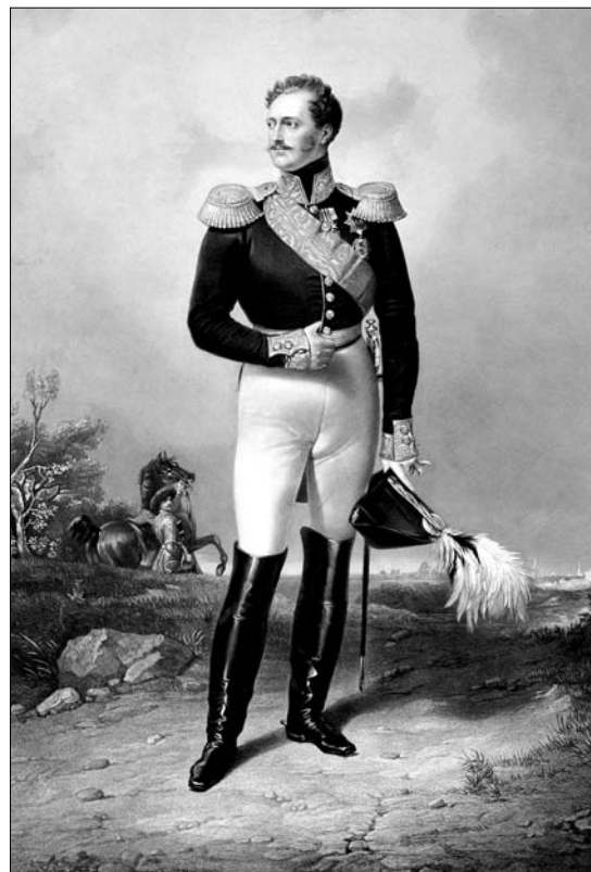
Николай I Худ. Ф. Кригекаль

Внимательный читатель журнала уваровских времён осознает, с каким сосредоточенным вниманием новый министр просвещения отнёсся к государственной идеологии, вне связи с которой он не мыслил просвещения. Сама идеология государства тоже была просветительской, с опорой на культовые фигуры российской имперской истории — великих императоров Петра и Екатерину. Прозорливость Уварова поражает: этот одарённый молодой человек, которого современники считали «бесхарактерным, суетным, легкомысленным», как никто в России того времени, понял богатырскую силу действенной идеологии для государственной жизни, для судеб просвещения. Можно не разделять постулатов Уварова, не всё в них было на пользу России, но следует признать, что в целом это был прорыв. Ему удалась насыщенная, реалистичная и духоподъёмная программа. И сложилась она в воображении Уварова не в одночасье. Может быть, в его сочувствии к консервативным участникам «Беседы...» уже сквозила тоска по сплочению всех элит на основе национальной идеи. Он и создал центральную для нашей истории XIX века