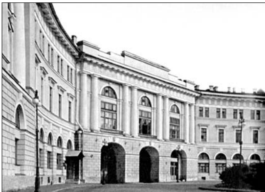
Санкт-Петербург. Министерство Народного Просвещения. 1828–1834 гг.

Таковы они, первые российские министры. А их министерства ждала великая судьба, продолжающаяся и в наше время. Голос Министерства иностранных дел нашей страны уверенно звучал во всём мире в годы правления таких мэтров дипломатического искусства, как «железные канцлеры» Александр Михайлович Горчаков и Андрей Андреевич Громыко. Министерство просвещения (сейчас — Министерство образования и науки) формировало и формирует не только образовательную политику, но и идеологию нашего государства, оказывая решающее влияние на интеллектуальный уровень общества, на его созидательные возможности. И в истории нашего общества были эпохи министров просвещения — Уварова, Толстого, Луначарского, Прокофьева... Эти эпохи пройдут перед читателем журнала. Вот и сейчас перед Министерством образования и науки стоит задача эквилибристской сложности: нужно пройти между Сциллой коммерциализации и Харибдой ограниченного