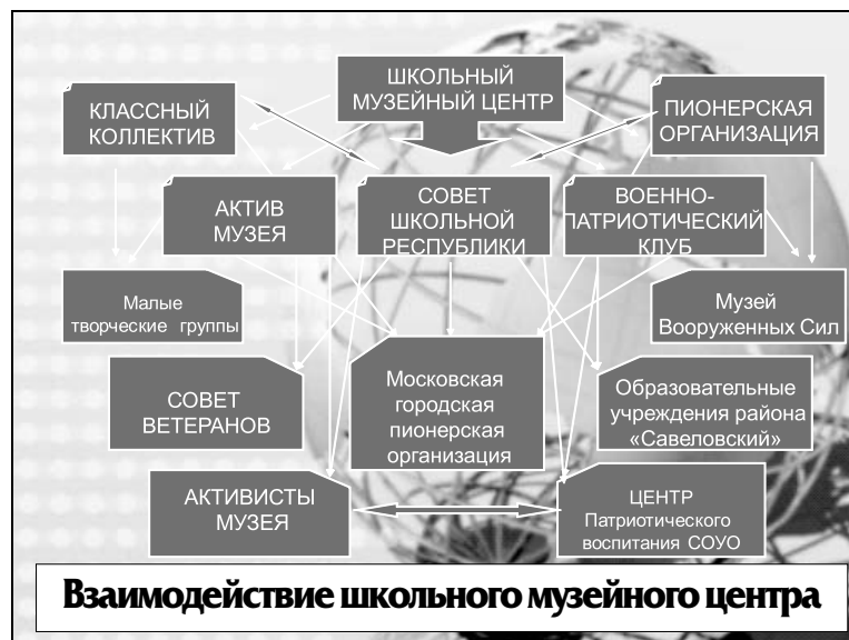
Схема 3. Внутреннее и внешнее взаимодействие школьного музейного комплекса (Центра) ОУ

Таким образом, модель функционирования и системы взаимодействия детских объединений образовательного учреждения ГБОУ СОШ № 694 представлена тремя взаимосвязанными блоками: теоретико-методологическим , представленным целью, задачами, подходами, прин-