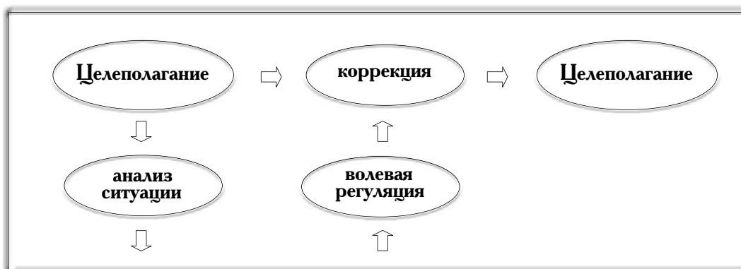
Схема 1. Модель индивидуальной самоорганизации

На индивидуальном уровне самоорганизация — интегральная совокупность природных и социально приобретённых свойств, воплощённая в осознаваемых особенностях воли и интеллекта, мотивах поведения и реализуемая в упорядоченности деятельности и поведения. Это показатель личностной зрелости. Самоорганизация может быть выражена в разной степени. Первым признаком высокой самоорганизации следует считать активное самосознание себя как личности (см. схему 1).