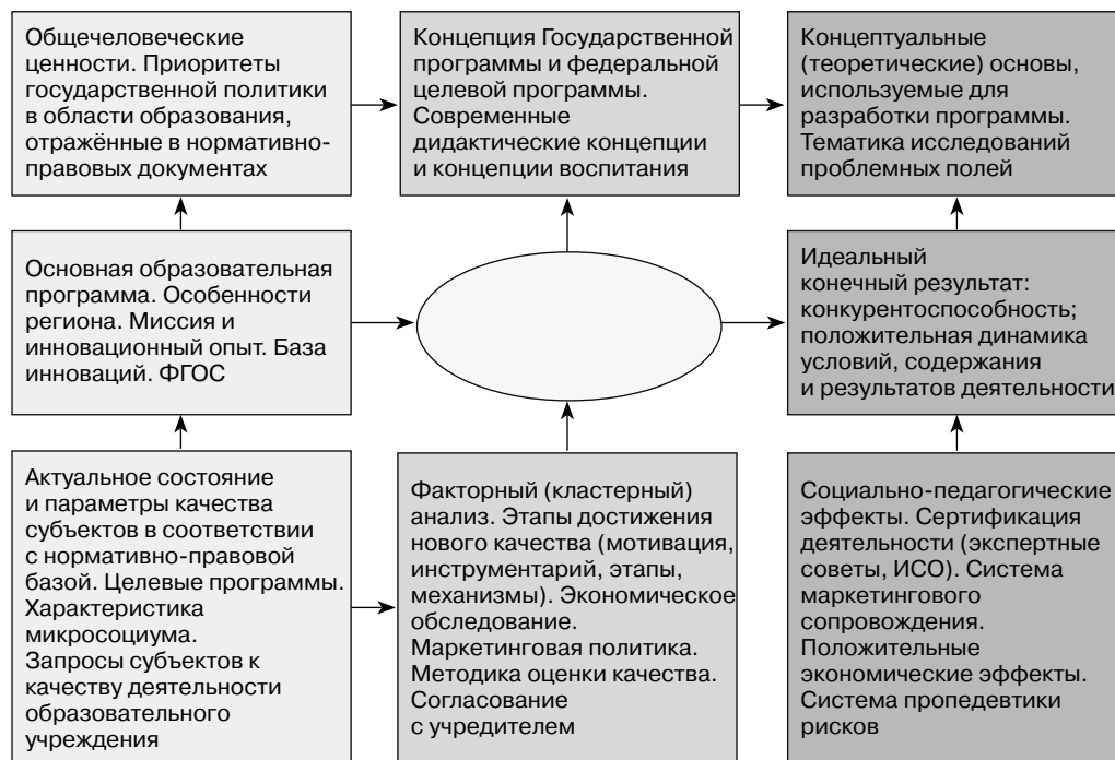
Схема 1. Ориентировочная схема разработки программы развития

Определим наиболее общие подходы к созданию программы развития и основной образовательной программы. Эти подходы можно выразить в ориентировочных схемах, структура и содержание которых определены с учётом представленных в разделе определений 3 (схема 1).