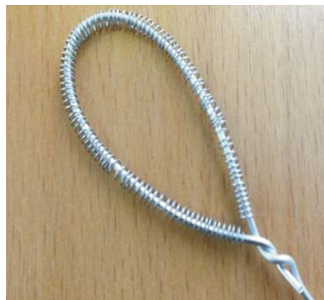
Рис. 3. Будущий лепесток

3. В пружинку вставить проволочку чуть толще длиной 15 см, согнуть, два конца проволоки скрутить, придать форму будущему лепестку (рис. 3).