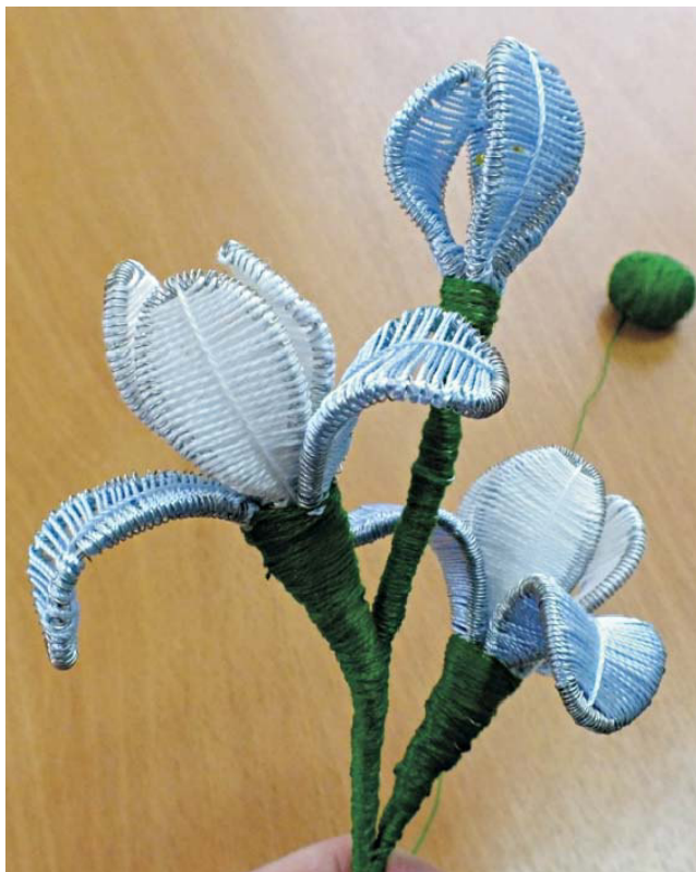
Рис. 11. Цветок, выполненный в технике ганутель

В результате у нас получился цветок, выполненный в технике ганутель (рис. 11). Если сделать несколько таких цветов, то из них можно составить композицию.