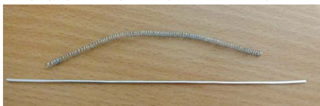
Рис. 2. Заготовка для лепестков

2. Сделать заготовку для лепестков. Снять получившуюся пружинку со спицы, подготовить ее для лепестков: аккуратно растянуть пружинку, отмерить по линейке нужную длину и разрезать на равные кусочки (8–12 см) (рис. 2).