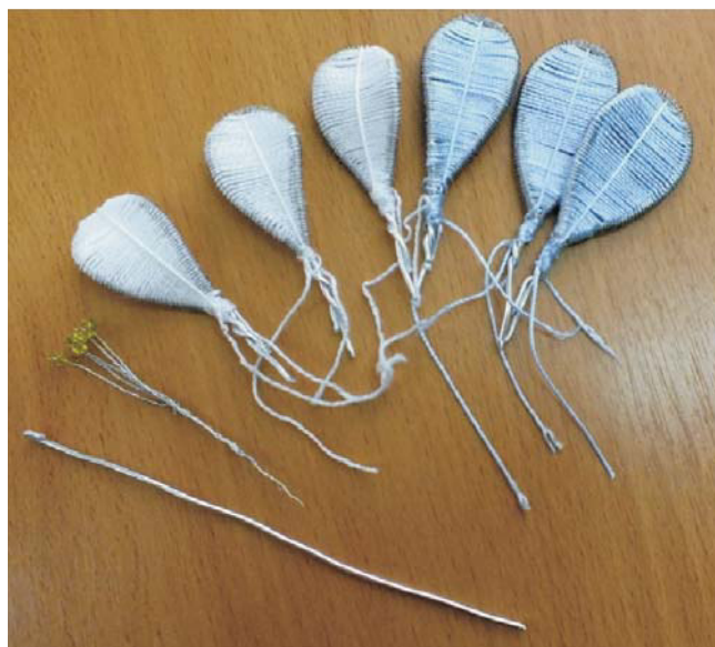
Рис. 7. Лепестки можно сделать одного цвета, но разного оттенка

Изготавливаем количество лепестков, необходимое для полного цветка, любым из предложенных вариантов (рис. 7).