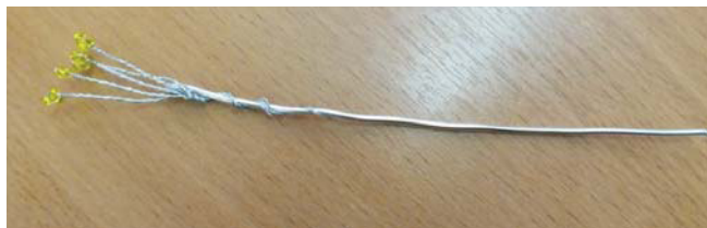
Рис. 8. Тычинки для цветка

обмотать нитками мулине, и покрасить блестящим лаком для ногтей (рис. 8).