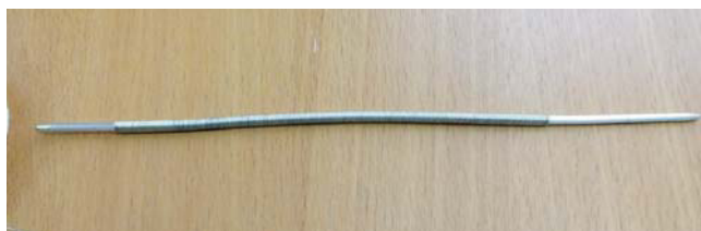
Рис. 1. Спица с намотанной проволокой

1. Аккуратно намотать на спицу проволоку (рис. 1). Размер спицы выбрать по необходимости. Следить за техникой безопасности, чтобы не пораниться о проволоку.