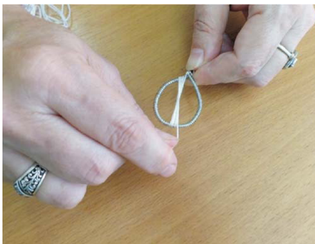
Рис. 5. Нить идет снизу вверх, смещаясь на один виток пружинки

Нитки располагать от основания лепестка к середине верха, а потом каждый виток смещать на один виток пружинки. При правильной обмотке все нитки будут пересекаться в середине лепестка (рис. 5).