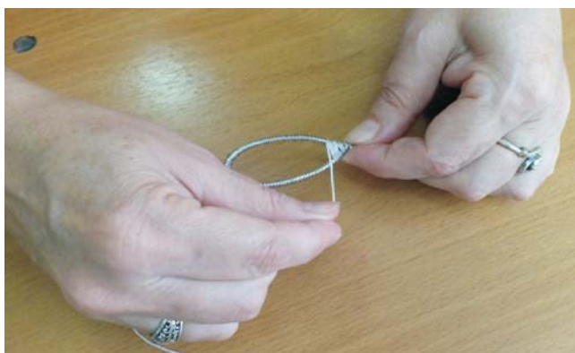
Рис. 4. Обматываем нитью, пропуская через каждый виток проволоки

Закрепить нитку на проволоке у основания лепестка петелькой. Обматывать лепесток, пропуская нитку между каждым витком пружинки. Не натягивать нитку сильно, особенно в середине лепестка, чтобы не изменить форму и не ослабить нитки у основания. Очень аккуратно обматывать вверху, чтобы не слетели ниточки. От середины верха лепестка протянуть нитку к основанию, сделав прожилку и закрепить узелком (рис. 4).