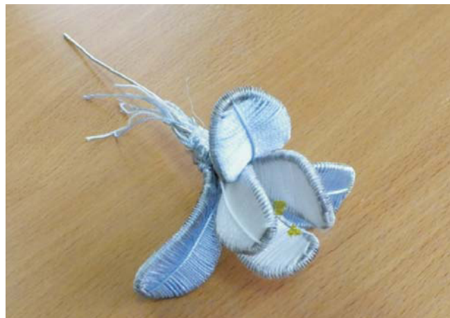
Рис. 9. Сборка цветка

Соединяем вместе все тычинки, закрепляя их нитками. Лепестки располагаем вокруг тычинок и крепко связываем нитками концы выступающей проволоки (рис. 9).